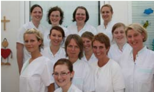
Das Team der K3